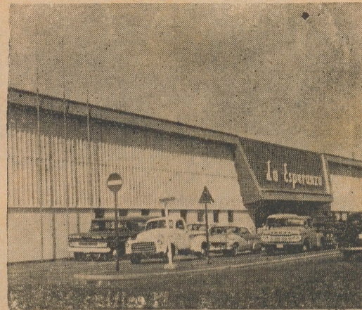
Esperanza Supermarket No. 2 Oranjestad